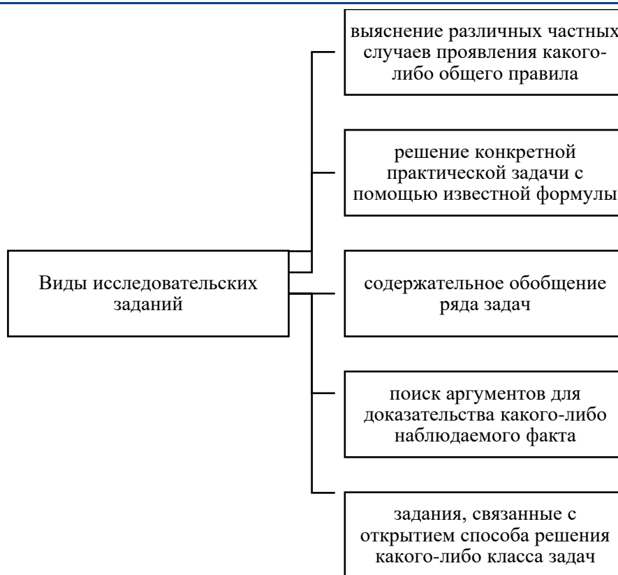
Рисунок 2 – Классификация исследовательских заданий

Для формирования знаний обучающихся четвертого класса о городе Севастополь можно предложить разнообразные исследовательские задания, которые помогут детям углубить свои знания о родном крае. Одним из примеров может быть задание на тему «Исторические памятники Севастополя». Обучающиеся могут выбрать один из памятников, изучить его историю, фотографии и значимость для города. По итогам исследования они могут подготовить презентацию или доклад: рассказать о своем выборе перед классом.