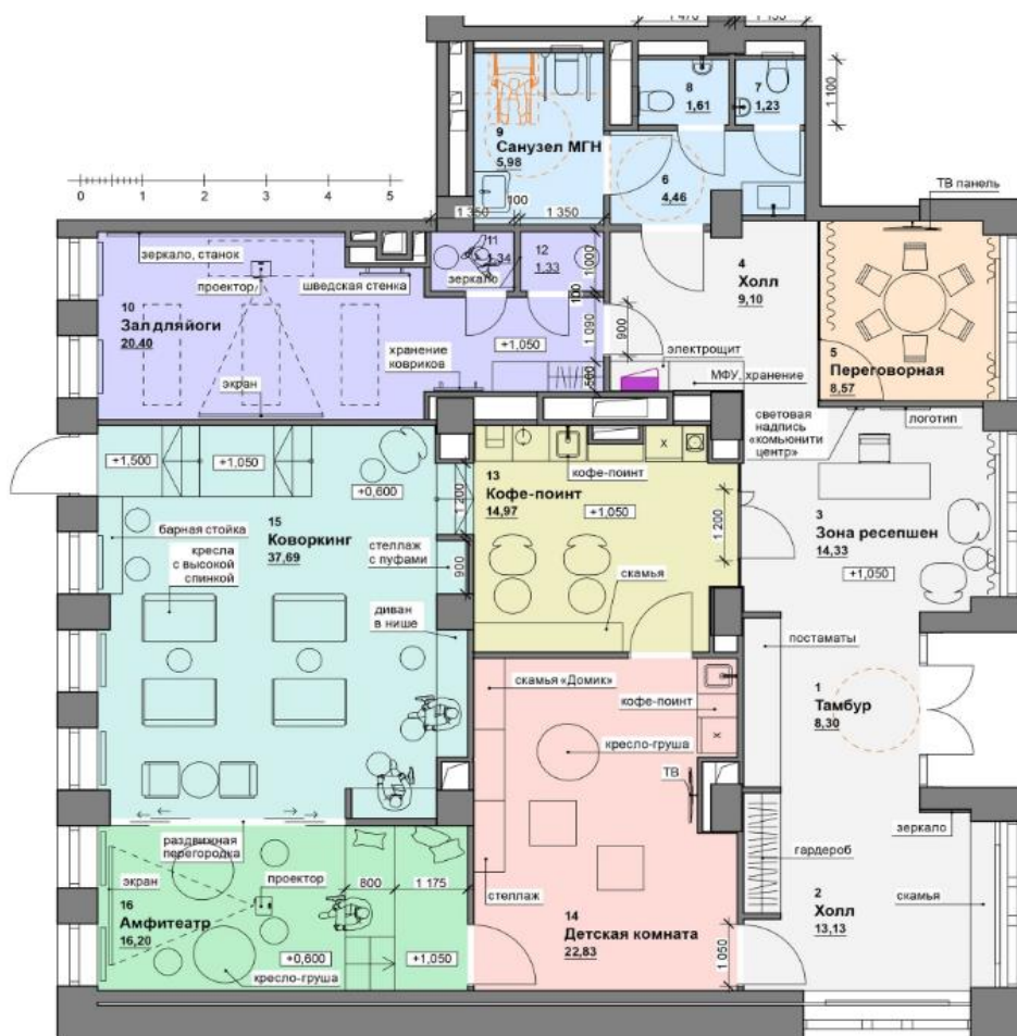
Рис. 4. Планировочные решения комьюнити-центра ЖК Golden City

На основе анализа приведенных примеров существующих комьюнити-центров можно вывести ряд основных особенностей функциональных зоны и состава помещений: