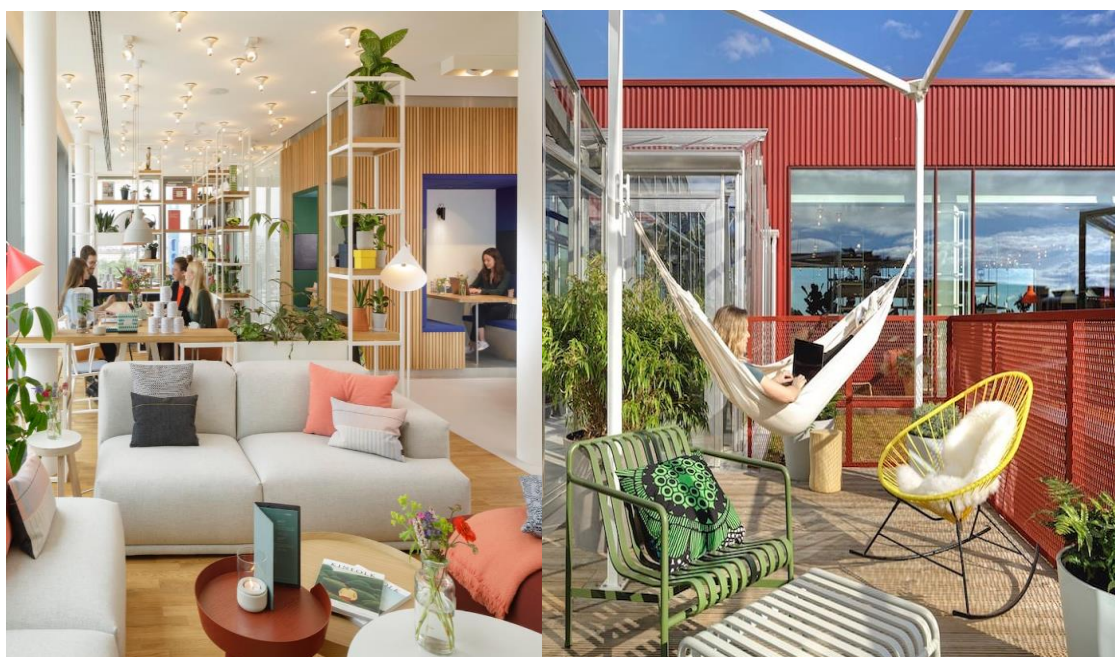
Рис. 1. Комьюнити-центр апарт-отеля Zoku в Амстердаме

Одним из пионеров в этой области стала сеть апарт-отелей Zoku, первый объект которой открылся в Амстердаме в 2016 году. Комьюнити-центр Zoku занимает целый этаж и включает открытую кухню-гостиную, коворкинг, библиотеку, игровые зоны и даже небольшой зимний сад на крыше (рис.1). Дизайн пространства минималистичен и функционален, с обилием естественного света, живых растений и экологичных материалов. Постояльцы могут не только работать и отдыхать, но и готовить вместе, проводить мероприятия, заниматься спортом или садоводством.