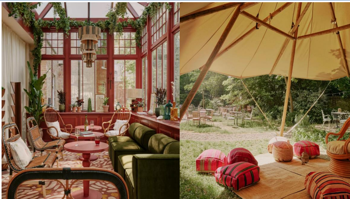
Рис. 2. Комьюнити-центр апарт-отеля Locke в Лондоне

Примером современного комьюнити-центра в России является ЖК Golden City. Комьюнити-центр расположен в коммерческом помещении на первом этаже жилого дома (рис.3). Площадь соседского центра – 180 кв. м, функционально он разделен на несколько зон и включает в себя кинозал, коворкинг, зал для занятий спортом, переговорную и детскую комнату (рис.4). Все пространство продумано как максимально мульти форматное и позволяет легко менять назначение использования. Для отдыха и общения, а также организации кинопоказов в комьюнити-центре организована зона кинотеатра. А перекусить и выпить вкусный кофе можно в зоне кофе-пойнта.