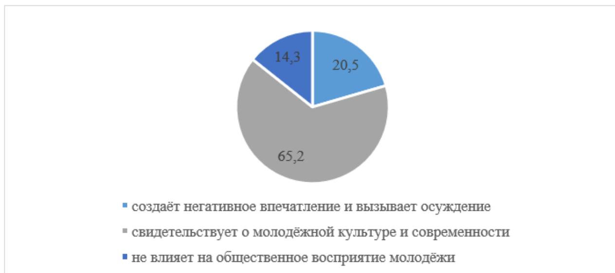
Рисунок 2 – Распределение ответов респондентов на вопрос: «Как вы считаете, какое влияние оказывает молодежный жаргон на общественное восприятие молодежи?»

Из ответов на первый вопрос видно, что большая часть молодёжи использует жаргонизмы, поэтому возникает вопрос: «Влияет ли использование жаргонов на общественное восприятие молодёжи?». Ответы были получены весьма разнообразные: 65,2% считают, что употребление жаргонной лексики свидетельствует о молодёжной культуре и современности. 20,5% респондентов, думают, что использование данных слов в речи создаёт негативное впечатление и вызывает осуждение. И самый малый процент опрошенных (14,3%) считают, что сленг никак не влияет на общественное восприятие молодёжи. (см. Диаграмму 2).