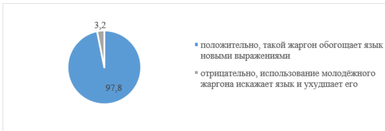
Рисунок 3 – Распределение ответов респондентов на вопрос: «Учитывая, что молодежный жаргон подвержен быстрой модификации, как вы оцениваете его влияние на развитие языка в целом?»

Как показывает исследование, использование жаргонной лексики свидетельствует о молодёжной культуре и современности, также большая часть опрошенных использует сленг в своей разговорной речи. Поэтому далее был задан вопрос: «Учитывая, что молодежный жаргон подвержен быстрой модификации, как вы оцениваете его влияние на развитие языка в целом?». Большинство молодые люди положительно относятся к жаргонной лексики, считая, что жаргон обогащает язык новыми выражениями (97,8%). Но некоторые, напротив, уверены, что сленг отрицательно влияет на языковую культуру, искажая язык и ухудшая его. (см. Диаграмма 3)