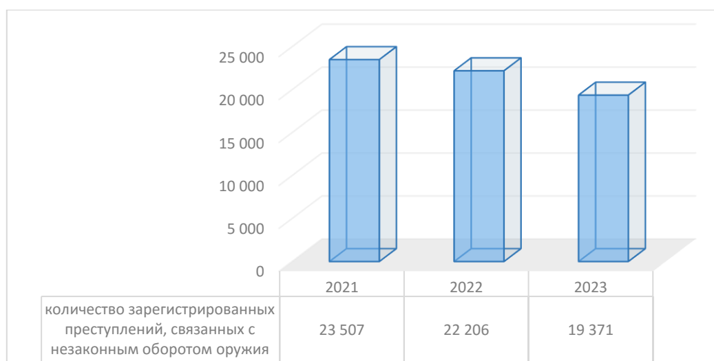
Рис. 1. Количество зарегистрированных преступлений в сфере незаконного оборота оружия, в России в 2021–2023 гг.

Одновременно на протяжении трех лет сокращалось число выявленных лиц, совершивших данные преступления. Так, в 2021 г. выявлено 11 048 лиц (-6%), в 2022 г. – 9 943 (-10%) в 2023 г. – 8943 (-10,1%). За 9 месяцев 2024 г. выявлено 6777 лиц, совершивших преступления, что также меньше показателя за аналогичный период предыдущего года на 12,4%. Таким образом, темпы выявления лиц, совершивших преступления в сфере незаконного оборота оружия, еще больше снижаются (среднее снижение три года – 8,7 %). По преступлениям, уголовные дела о которых окончены расследованием либо разрешены в отчетном периоде, темпы снижения примерно сопоставимы с приведенными выше показателями.