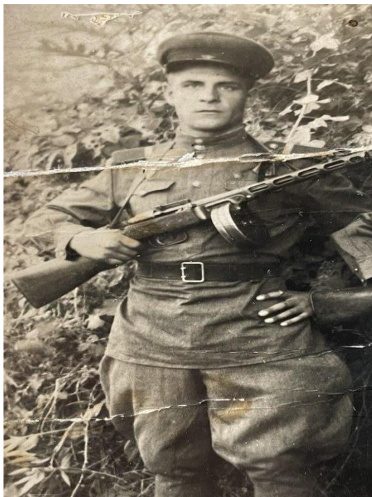
Рисунок 5 На службе в 61 полку.

3 декабря 1944 года новобранцев вместе с Гилемханом с ж/д станции Бугульма на поезде отправляют в учебную часть в город Новочеркасск. Вагоны поезда были предназначены для перевозки сельскохозяйственных животных, поэтому новобранцам пришлось ехать в тяжелых условиях без должного довольствия в течение 10 суток. После непродолжительного обучения уже в конце декабря 1944 направлен в 61 полк войск НКВД СССР (далее МВД СССР) на должность стрелка. В 61 полку он служил сопровождающим железнодорожного состава, который подвозил к линии фронта все то, что было необходимо войскам, а в обратную сторону загружались выведенная из строя боевая техника. По мере продвижения армии СССР на запад (освобождения и восстановления инфраструктуры) поезд в разное время дислоцировался в г. Воронеж, г. Ростов, станции Каменоломни (ныне п.г.т. Каменоломни Октябрьского района Ростовской области). Во время службы моего деда в 61 полку войск НКВД СССР основным пунктом дислокации была железнодорожная станция Каменоломни. (Рис. 5).