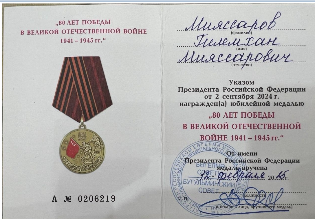
Рисунок 9 Удостоверение о награждении юбилейной медалью. (личный архив)