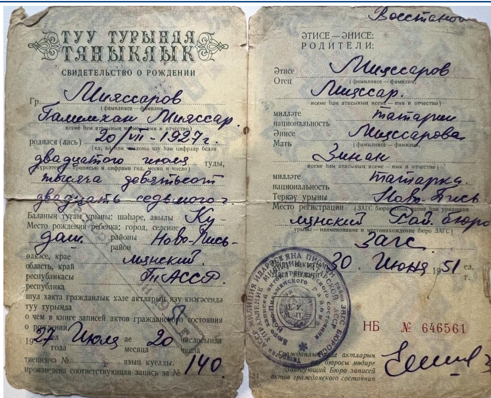
Рисунок 1 Свидетельство о рождении.