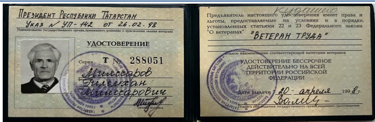
Рисунок 11 Удостоверение о присвоении статуса «Ветеран труда». (личный архив)