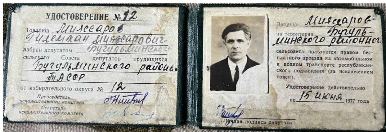
Рисунок 7 Удостоверение депутата.

В 1975 году вступил в партию. В 1977 избран депутатом Кудашевского сельского Совета депутатов трудящихся, неоднократно переизбирался и оставался депутатом до марта 1995 года.