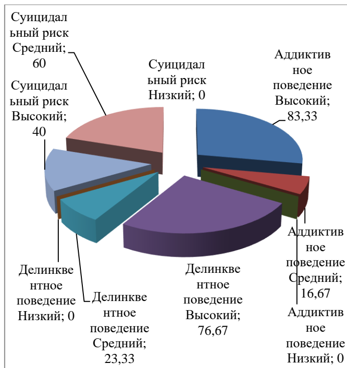
Рисунок 1. Процентное распределение уровней склонности к видам девиантного поведения в экспериментальной, n=30 , и контрольной, n=30 , группах.