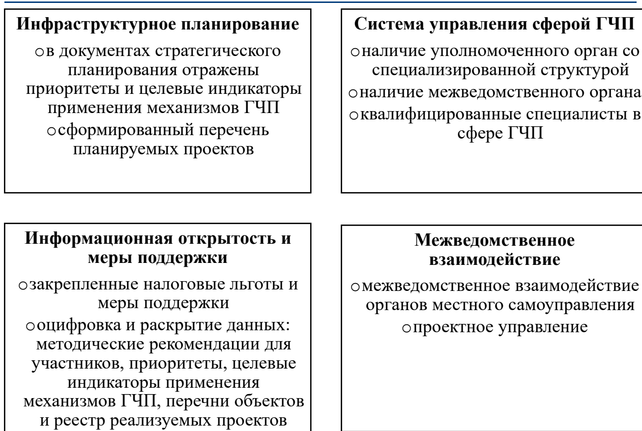
Рис. 2 Критерии оценки институциональной среды и нормативно-правовой базы, методика ВЭБ.РФ [6].

Анализ лучших практик развития государственно-частного партнерства в России по результатам 2024 г. отражает высокие показатели в отношении качества системы управления сферой ГЧП, что выражается в наличии специализированного органа, межведомственного органа и соответствующей квалификации кадров, однако межведомственное взаимодействие в рамках рейтинга характеризуется невысоким качеством. Самые низкие показатели отражает трек «инфраструктурное планирование», который предполагает разработку региональными властями приоритетов, а также целевых индикаторов применения механизмов ГЧП, основанных на инфраструктурной потребности региона. Отражение целевых метрик планируемых проектов в документах долгосрочного стратегического планирования обеспечивает базис долгосрочного планирования для частных акторов и представляется ключевым элементом инвестиционной привлекательности региона. По результатам 2024 г. качественной системой инфраструктурного планирования обладают лишь 54% городов лидеров рейтинга.