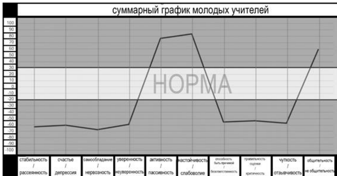
Рис.3- Суммарный график личностных характеристик молодых учителей

У молодых учителей был обнаружен психологический портрет (см. Иллюстрацию 3) с разобщенностью, депрессией и нервозностью, они также проявляют значительную неуверенность в себе. Графики показывают проблемы с недостатком ответственности, критичности и отзывчивости. Эти проблемы, вероятно, возникли из-за высокой нагрузки на работе в школе. Они компенсируют эти дефициты активностью, настойчивостью и коммуникабельностью.