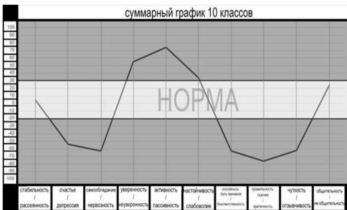
Рис.1-Суммарный график личностных характеристик 10-х классов

В 10 классах были выявлены психологические профили (см. Рисунок 1), характеризующиеся нервозностью, депрессией и самокритичностью, которые компенсируются уверенностью в себе, гиперактивностью и настойчивостью.