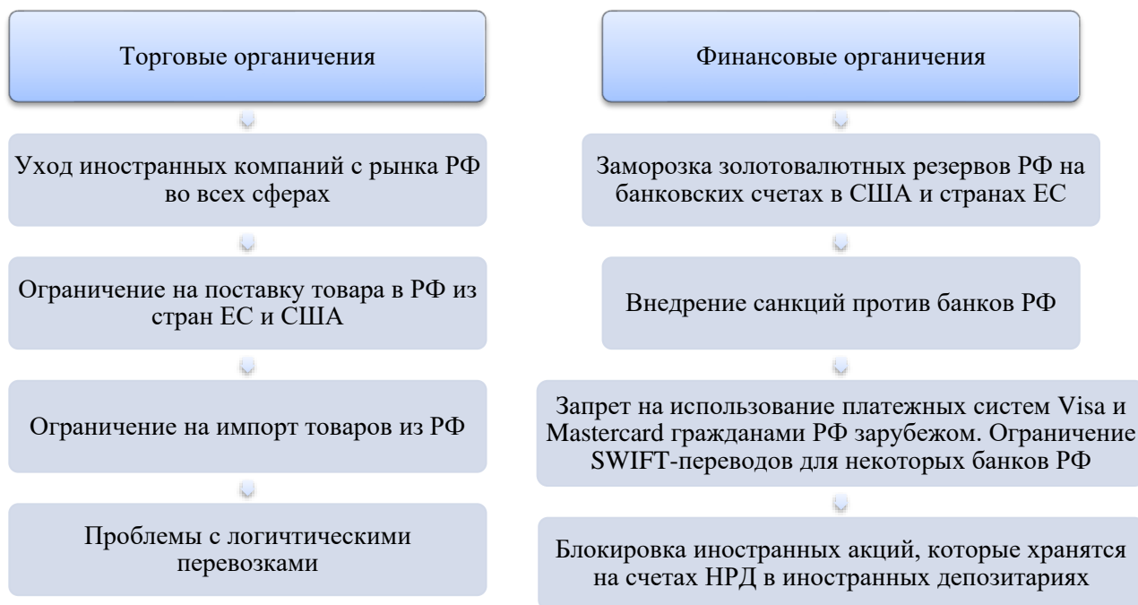
Рисунок 1 – Ограничения в условиях санкций против РФ в 2022 году

Представленные ограничения призваны были в короткий срок дестабилизировать экономику Российской Федерации и всю финансовую систему страны. Несомненно, представленные ограничения отразились на росте цен, нехватке товаров и валютных ограничениях. Важная роль отводится в этой связи денежно-кредитному регулированию в целях поддержания роста экономики и стабилизации российской финансовой системы. Поэтому в 2023-2024 годах продолжилась реализуемая политика Банка России по укреплению финансовой устойчивости и развития экономики.