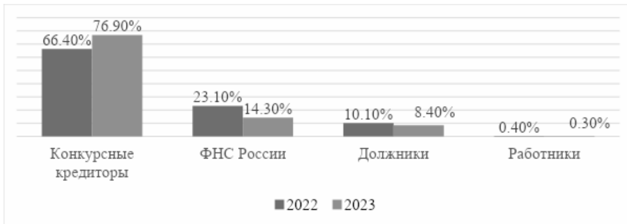
Рис. 2. Инициаторы дел о банкротстве компаний [4].

На рисунке 2 продемонстрируем данные о инициаторах дел о банкротстве компаний за 2022-2023гг.