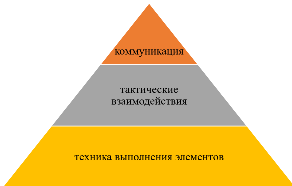
Рисунок 1. Иерархия компонентов подготовки в пляжном волейболе по результатам опроса (n=60).

Результаты и их обсуждение. В ходе исследования коммуникация была отмечена, как один из ведущих компонентов достижения спортивного результата. См. рисунок 1.