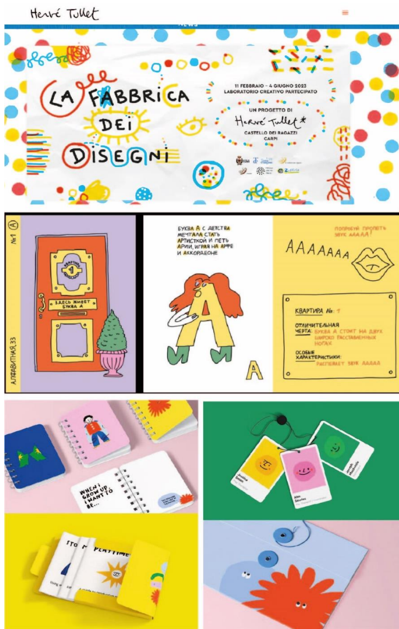
Рисунок 3 – Тренды в области дизайна цифрового продукта

Учитывая, что последними трендами в области дизайна цифрового продукта является его интерактивность, контрастность, стилизованность под детские рисунки, детский почерк, выстраивание концепции через «детский взгляд», а также «чистый» стиль, минимализм (рисунок 3), можно сделать вывод о том, что существующим на сегодняшний день материалам по изучению иностранного языка не хватает глубокой системной проработки, какую могли бы они нести, если бы разработкой пособий занимались методисты в команде с дизайнерами.