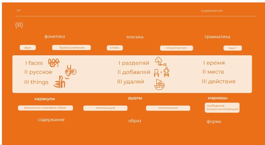
Рисунок 4 – Структура визуального пособия

Анализ и синтез визуальной и языковой систем, где при их сопоставлении были выделены основные их три раздела (языковая – фонетика, лексика, грамматика, визуальная – точка, линия, пятно), позволил составить на основе усложнения и базовых языковых и визуальных единиц вспомогательные элементы: каракулю, дудл и маркер (рисунок 4).