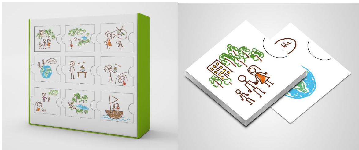
Рисунок 6 – Настольная игра

Данную методику можно использовать и в формате офлайн-занятия. Печатный продукт оформлен в виде настольной игры и позволяет продолжить изучение лексики английского языка, основные правила и задания для которой изложены в цифровом продукте. Механика карточек игры основана на карточках Проппа, что дает возможность создавать с ребенком истории на английском языке на любую базовую тему (рисунок 6). При этом дизайн карточек выдержан в рамках концепции «детский взгляд» и стилизован под детские рисунки, чтобы ничего не отвлекало ребенка от собственного творчества.