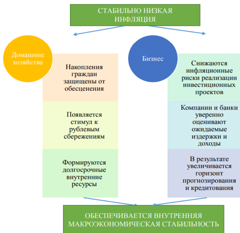
Рисунок 2 – Ориентация антиинфляционной политики Банка России[0, с. 57]

Банком России производится контроль величины денежной массы, находящейся в обращении, что является важным направлением антиинфляционной политики, также, проводимой данным институтом финансового контроля. Результаты реализации антиинфляционной политики приведены на рисунке 2.