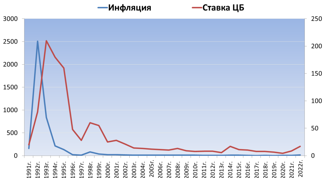
Рисунок 3 – Зависимость инфляции и ключевой ставки ЦБ РФ[0]

Масштабы операций коммерческих банков регулируются посредством процентной политики и проведения операций на открытом рынке. С целью регулирования уровня спроса и предложения денег на рынке Банк России, выбрав политику «дешевых денег», может снижать ставки по кредитам, тем самым ослабляя контроль над увеличением денежных средств в обращении и расширяя масштабы кредитования. Политика «дорогих денег», как раз наоборот ориентирована на сокращение масштабов кредитования.