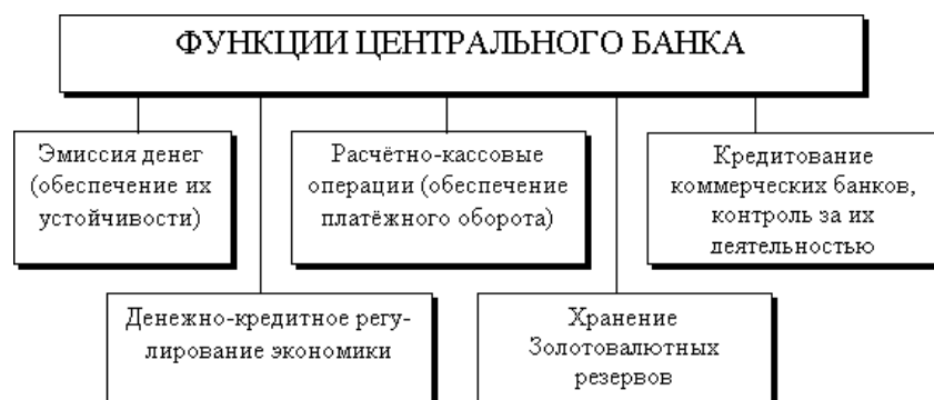
Рисунок 1 – Функциональная роль ЦБ РФ[0]

Функциональная роль данного института представлена на рисунке 1.