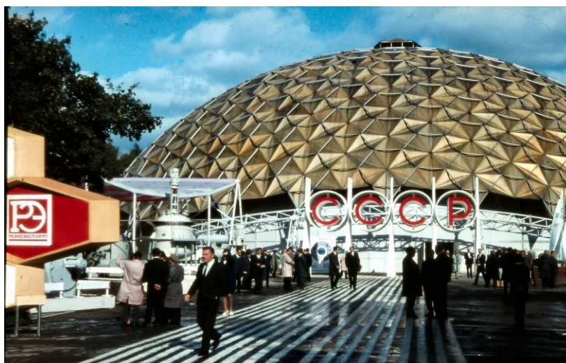
Рисунок 1. Павильон СССР в Сокольниках.

В 1966 году в 20 павильонах на площади в 50 тыс. м 2 разместилась экспозиция международной выставки «Интероргтехника» [5]. Павильоны монтировались в разных частях парка в зависимости от потребностей того или иного проекта. В годы расцвета выставочного комплекса в «Сокольниках» насчитывалось 22 павильона. Самая большая общая (закрытая и открытая) площадь экспозиции – 65 тыс. м 2 , была задействована на выставке «Химия-70». Много лет «Сокольники» были единственной в СССР выставочной площадкой международного уровня (рис 1).