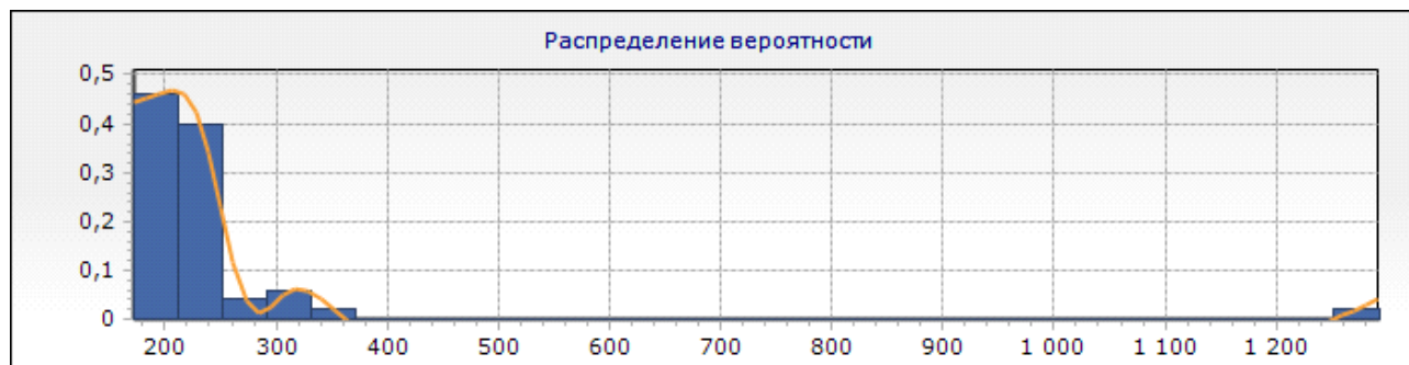
Рис. 1 До приема препарата

Результаты исследований. Оценка результатов по методике "Простая зрительно-моторная реакция" производилась на основании среднего значения времени реакции и числа допущенных ошибок. Полученные в ходе исследования результаты представлены на рисунке 1 и 2.