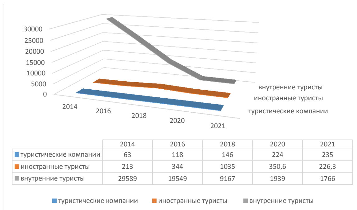
Диаграмма 1. Основные статистические показатели туризма

Можно сравнить показатели этой диаграммы, количество туристических компаний год от года улучшается. С 2014 по 2021 год количество туристических компаний на территории Таджикистана увеличилось до 172, также улучшается количество отечественных и иностранных туристов. Если проанализировать, то можно увидеть, что количество иностранных туристов, которые по информации органов госпогранслужбы въехали в страну в качестве туристов, из показателей 2019 года, общее количество туристов составило 1257 человек, что значительно выше чем в 2020 и 2021 годах [6]. Безусловно, развитие туризма положительно влияет на улучшение инфраструктуры.