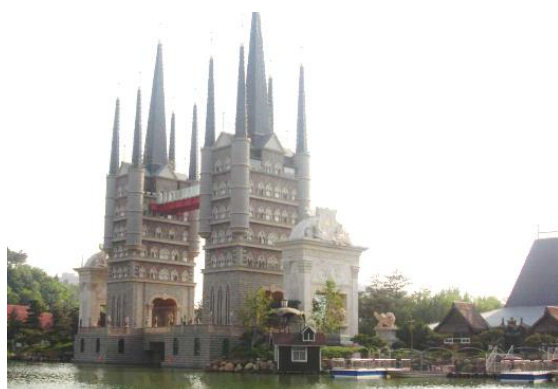
Рис. 5. Средневековые башни. Выставочные залы