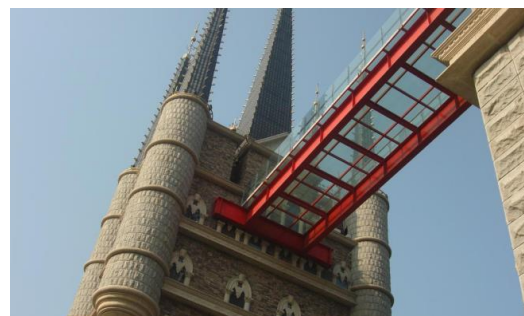
Рис. 6. Стеклоанный мост

Классическая организация университетских кампусов сохраниться на длительную перспективу. Новые цифровые технологии (дополненная и виртуальная реальность) и архитектурные направления (медиа и кинетическая архитектура), повлияют на формирование молодежной среды и определят новые парадигмы в средовой организации.