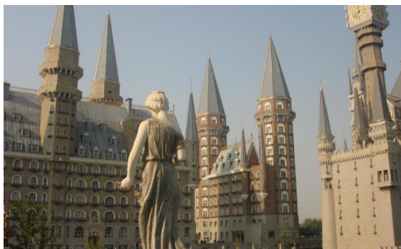
Рис. 1. Площадь «Империя искусств»