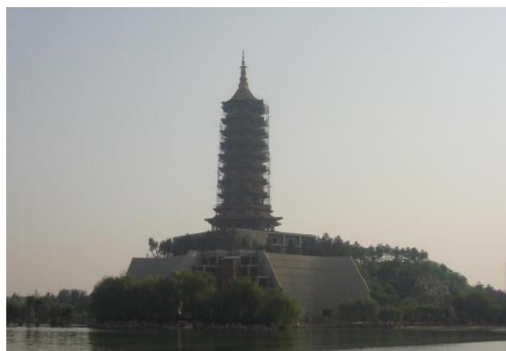
Рис. 3. Пагода в китайской зоне