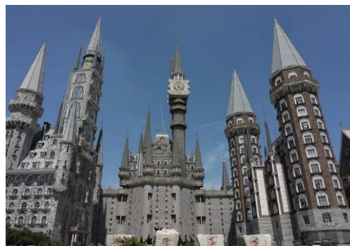
Рис. 2. Зона «Заколдованная группа замков»