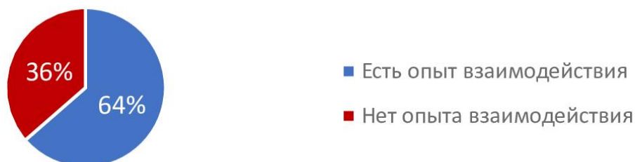
Рис. 2 Опыт взаимодействия с центрами «Моя карьера», «Моя профессия» ознакомленной с ее деятельностью части молодежи

На вопрос «Знакомы ли Вы с деятельностью таких специализированных центров, как «Моя карьера», «Моя профессия» 80,4% респондентов (90 чел.) ответили отрицательно и 19,6% (22 чел.) положительно. Осведомленность молодежи в части деятельности этих центров оказалась низкой. Среди тех респондентов, которые осведомлены о деятельности специализированных центров «Моя карьера», «Моя профессия», 63,6% (14 респондентов из 22) имеют опыт взаимодействия с одним или двумя центрами (рис. 2).