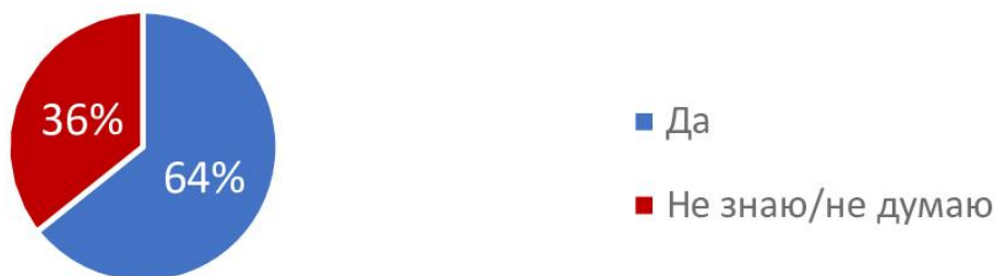
Рис. 5 Повлияет ли цифровизация служб занятости на повышение занятости среди молодежи города Москвы?

Ответы на вопрос: «Повлияет ли цифровизация служб занятости на повышение занятости среди молодежи города Москвы?» (рис.5) показали, что 72 респондента (64,3%) считают, что цифровизация служб занятости положительно повлияет на трудоустройство, 40 респондентов (35,7%), ответили, что они не знают или не думают, что цифровизация служб занятости сильно повлияет на рост уровня занятости молодежи Москвы.