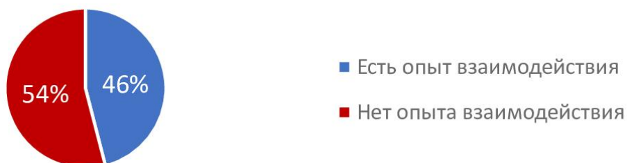
Рис. 1. Опыт взаимодействия молодежи, знакомой с деятельностью центра занятости «Моя работа»

Для выявления уровня удовлетворенности молодежи процессом цифровизации при оказании содействия в трудоустройстве службой занятости населения города Москвы «Моя работа», а также специализированными центрами «Моя карьера», «Моя профессия» нами был проведен онлайн опрос среди молодежи Москвы от 18 до 35 лет, получающих/получивших высшее образование. Участие в опросе приняли 112 респондентов: 70 женщин (62,5%) и 42 мужчины (37,5%). Анкета рассылалась онлайн в беседы и группы таких вузов Москвы, как Российская академия народного хозяйства при Президенте РФ, Московский политехнический университет, Московский государственный институт международных отношений МИД РФ, НИУ ВШЭ, Дипломатическая академия МИД РФ и др. Ссылка на опрос была опубликована в телеграм-канале агентства социально-политических и маркетинговых исследований «Russian Field». На вопрос «Знакомы ли Вы с деятельностью центра занятости «Моя работа» положительно ответили лишь 26 респондентов (23,2%). Опыт взаимодействия (обращения) с этим центром имеют 12 опрошенных (10,7%) (рис. 2). Эти данные отражают тот факт, что молодежь города Москвы слабо знакома с деятельностью центра занятости населения города. Так, среди тех, кто ознакомлен с деятельностью центра занятости, 46% имеют опыт взаимодействия с центром (12 человек из 26) (рис.1), что говорит о некоторой заинтересованности молодежи.